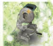
Saw Cutting Machine