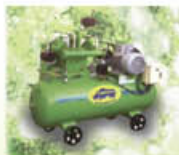
Reciprocating Air Compressors