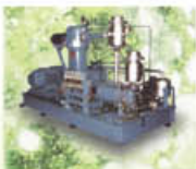
High Pressure Air Compressors