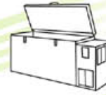
ตู้แช่เย็น