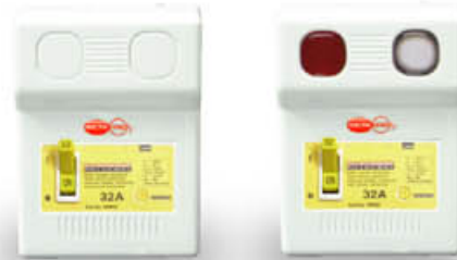
EXAMPLE FOR MODULAR ENCLOSURE BREAKER

ป้องกันไฟรั่ว ไฟลัดวงจร ไฟเกิน แรงดันไฟฟ้าเกินกำลัง